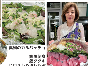
真鯛のカルパッチョ