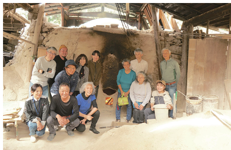
紀州備長炭窯元小守さん窯場にて